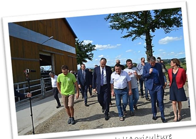
Didier Guillaume - Ministre de l'Agriculture