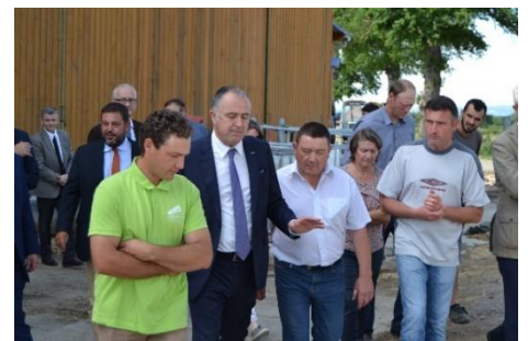
Visite du Ministre de l'agriculture, Didier Guillaume, le 6 juin 2019

LABYRINTHE 2023 NOUVEAU THÈME « Les métiers de l'agriculture ! »