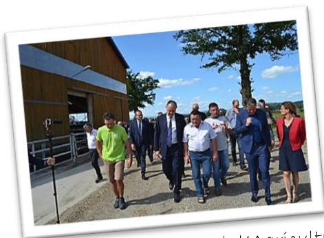
Didier Guillaume - Ministre de l'Agriculture