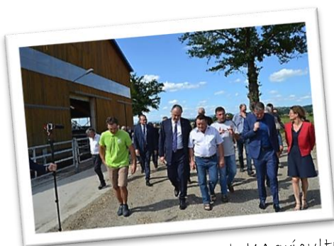
Didier Guillaume - Ministre de l'Agriculture