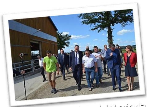
Didier Guillaume - Ministre de l'Agriculture